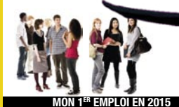
MON 1 ER EMPLOI EN 2015