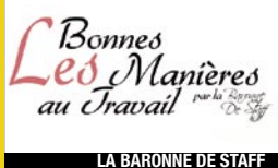
Les Bonnes Manières au Travail